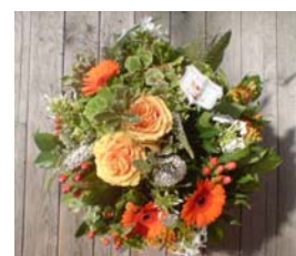
Foto: Mit diesem Blumenstrauß gratuliert der RR Club Joker den frisch gebackenen Eltern!

Mal sehen, ob der kleine Spross in ein paar Jahren, in die Fußstapfen seiner Eltern tritt und ein aktiver Joker-Tänzer wird!?